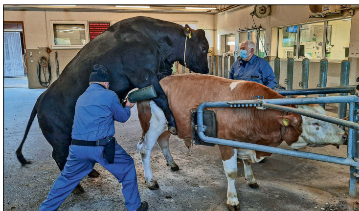
PARADOX étant jeune, sa semence est récoltée à l'aide d'un taureau boute-en-train.

Lorsque le tour est à PARADOX, Beat le conduit derrière un taureau Simmental. Le taureau Angus noir met sa tête sur le dos de son congénère. Ensuite, il chevauche. «Les visiteurs sont étonnés qu'il ne nous faut pas de vaches à la